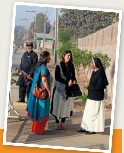
Overal is beveiliging nodig

Ja, vanwege de vervolgingen waaraan ze blootgesteld worden, willen ze Pakistan verlaten. Ze zien het als hun laatste optie. De situatie in het land – toenemende radicalisering, groeiend fundamentalisme en het misbruik van de blasfemiewet – hebben ertoe geleid, dat christenen zich zeer bedreigd en onveilig voelen.